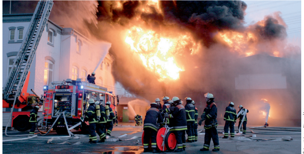
Brand in Hamburger Lagerhalle am 2. Januar 2012

Schnell nimmt ein Horrorszenario seinen Lauf: ein übergreifendes Feuer von Ihrem Grundstück, geschädigte Firmen in der Nachbarschaft, vom Löschwasser verstopfte Siele, verseuchtes Grundwasser und kontaminierter Boden!